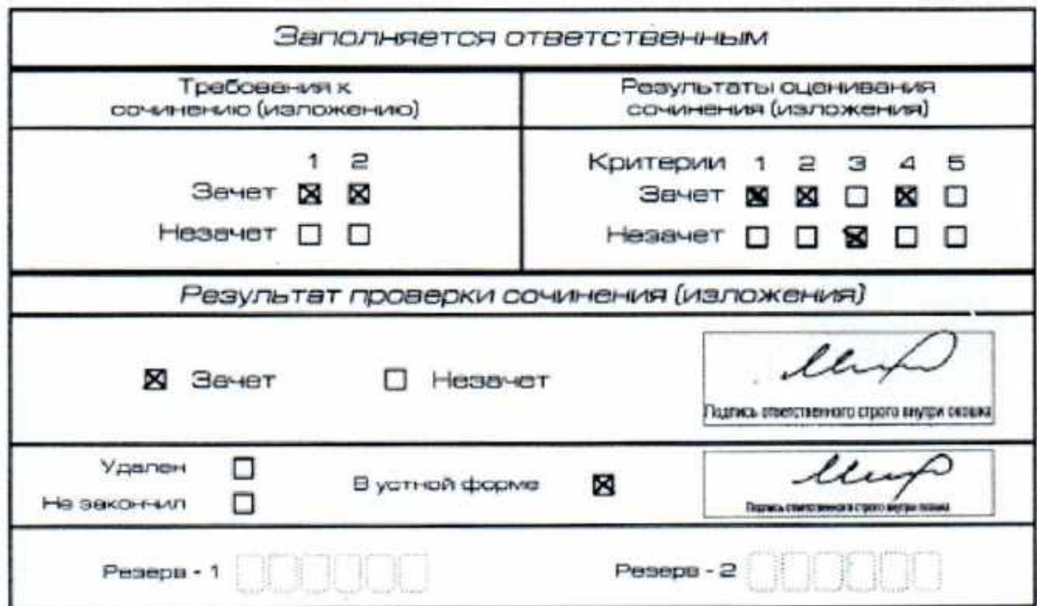
Рис. 12. Область для оценки работы сочинения (изложения) в устной форме

После окончания заполнения бланка регистрации ответственное лицо ставит свою подпись в специально отведенном для этого поле.