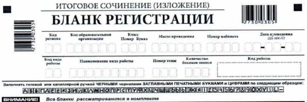
Рис. 2. Верхняя часть бланка регистрации

По указанию члена комиссии, осуществляющего инструктаж участников итогового сочинения (изложения), участником заполняются все поля верхней части бланка регистрации (табл. 1), кроме полей «Количество бланков записи» и «Код работы».