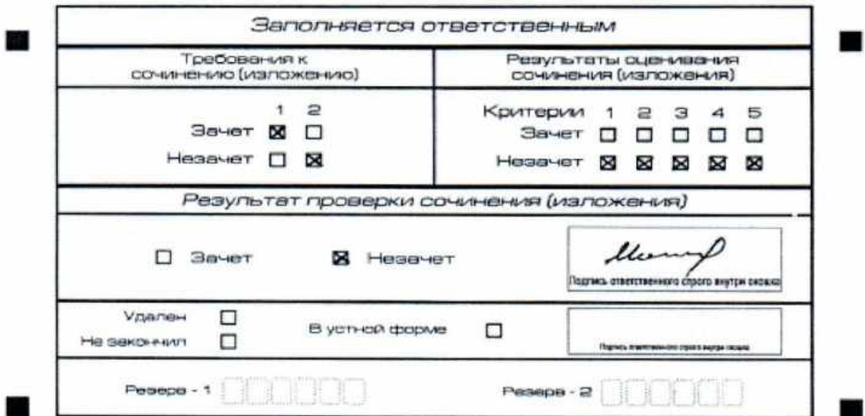
Рис. 9. Область для оценки работы

по всем критериям оценивания выставляется «незачет». В поле «Результат проверки сочинения (изложения)» ставится «незачет» (рис. 9).