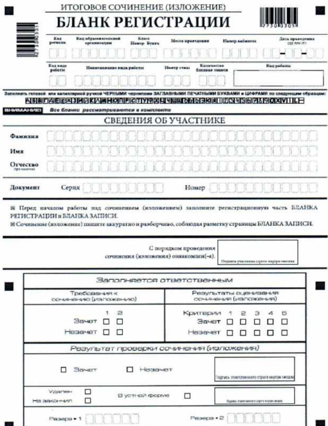
Рис. 1. Бланк регистрации

Бланк регистрации (рис. 1) состоит из трех частей – верхней, средней и нижней.