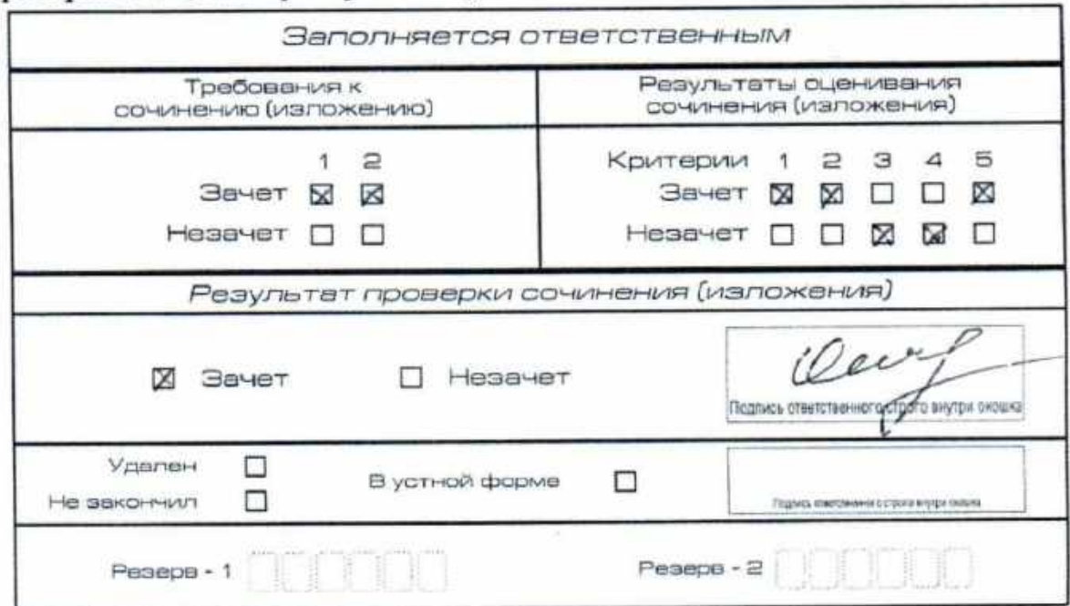
Рис. 10. Область для оценки работы