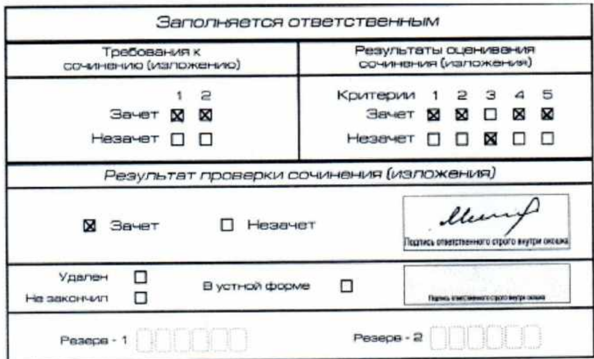
Рис. 11. Область для оценки работы