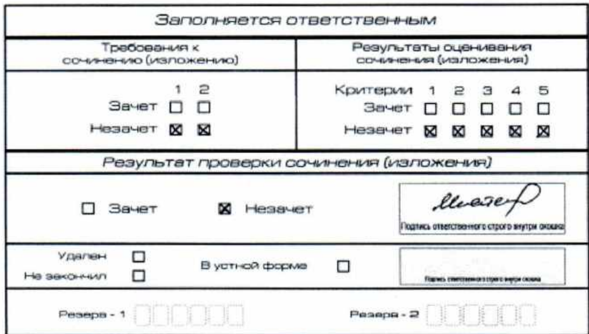
Рис. 8. Область для оценки работы

В клетки по всем требованиям (№ 1 и № 2) и критериям оценивания выставляется «незачет». В поле «Результат проверки сочинения (изложения)» ставится «незачет» (рис. 8).